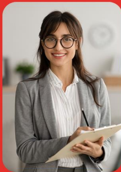
Profissionais de Psicologia