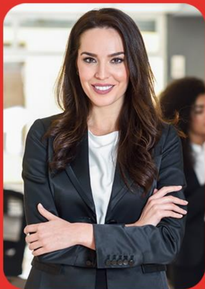
Profissionais de Recursos Humanos