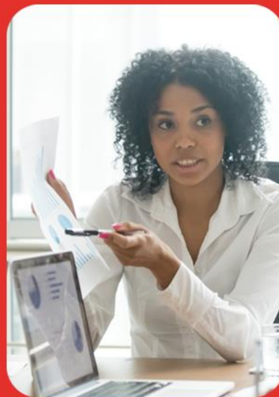
Profissionais de Consultoria