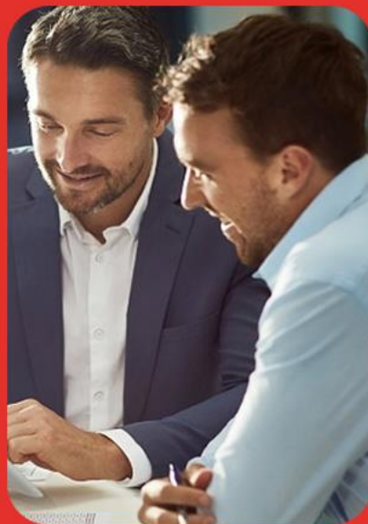
Profissionais de Contabilidade